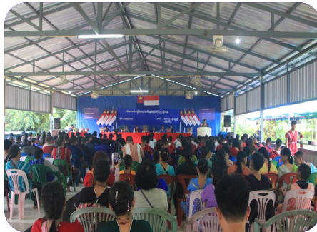
တံမလကပိ ကညိဒိကလုာ်ဟးကိရ်သုးမုဒ်နံ ပူထိတ် (၃၂) နှ် အမူး (၂၀၂၃ နှ် လါစဲးပထုဘာ် ၉ သီ)