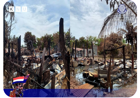
သုးမိစိရိအသုးတဖှ် ဒွဲင်အုဝဲကဖျာ်ဟံ (၂၃) ဖျာ် ဒီး ဘုမိ (၃) ဖျာ်၊ ဆဲလိပ်မုဒ်ဗိလါ သဝိပူအါအါဂိဂိ - ချှ်လွံဂ်ထွာ်ကိရ် (၂၀၂၃ နှ် လါစဲးပထုဘာ် ၁၄-၁၇ သီ)