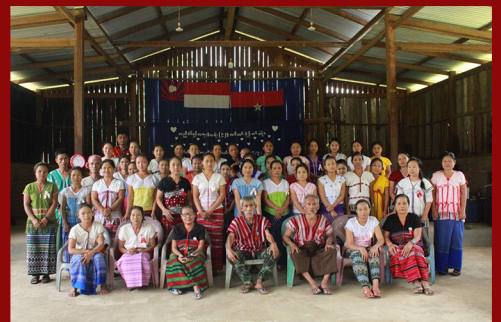
မူးမြို့နယ်၌ ကြိမ်မြောက် ကရင်အမျိုးသမီးအစည်းအရုံး တွန့်တရက်

ကေအန်ယူ - ကရင်အမျိုးသားအစည်းအရုံး (ဗဟို)၊ နိုင်ငံရေးနှင့် စည်းရုံးရေးကော်မတီ၊ ပညာပေးရေးနှင့် ဖွဲ့စည်းတည်ဆောက်ရေးလုပ်ငန်းကော်မတီမှ ထုတ်ဝေသည်။