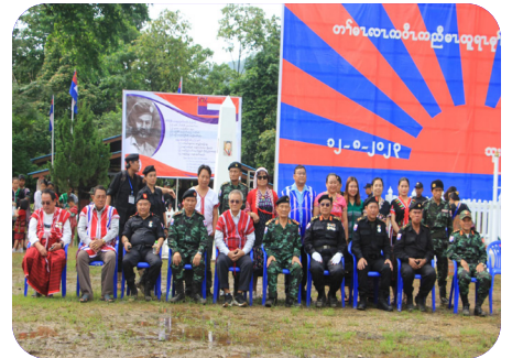
တံမလကပိ ကညိဒိကလုာ်မထုရုမုဒ်နံ ဝဲ ဖှ်အုတ်ကိရ် (၂၀၂၃ နှ် လါအိးကူး ၁၂ သီ)