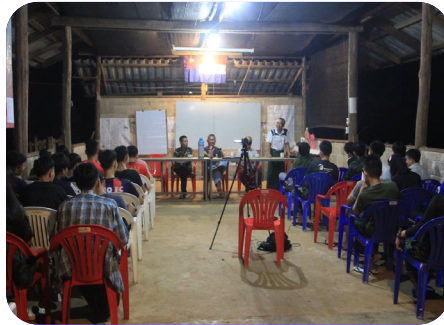
ကိရ်ရုဒ်ဒိဒ်တဖှ် ဟံအိတ်သကိး ဟုတ်ဂံဟုတ်ဘါ စာသွဲဒ်သီကွဲးတဖှ် (၂၀၂၃ နှ်)