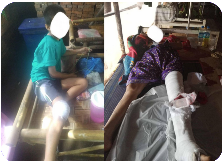
သုးမိစိရိအသုးတဖှ် ခးလိကျိဖးဒိဒ်အယ် ဘှ်ဒိဝဲ မိသု်မိခွါ (၁) က ဒီး ပိတ်မုဒ် (၁) တက ဝဲ ဒုသထွာ်ကိရ် (၂၀၂၃ နှ် လါစဲးပထုဘာ် ၈ သီ)