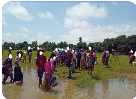
သုးမိစိရိအသုးတဖှ် ဒိဖျိသုဝဲဒုင်ကဘိယုဒီး ခးလိတါလါ သဝိပူအယ် သဝိမိလါ သဝိ (၆) ဖျာ်၊ ပူနိဒ်ဂိ (၅၂၉၅) က ဘှ်ယုထိပ်လါသဝိပူ၊ ချှ်လွံဂ်ထွာ်ကိရ်၊ မူကိဆုတ် ဟိတ်ကဝိပူ (၂၀၂၃ နှ် လါစဲးပထုဘာ် ၁၄ သီ)