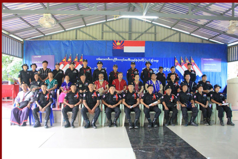
(၃၂) နှစ်မြောက် ကရင်အမျိုးသားရဲတပ်ဖွဲ့နေ့ ဗားအံရိုင်တွင် ပြုလုပ်