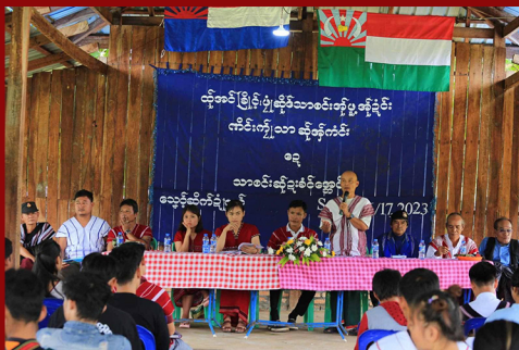
ဗားအံရိုင် ကရင်လူငယ်အစည်းအရုံး နှစ်ပတ်လည် အစည်းအဝေး