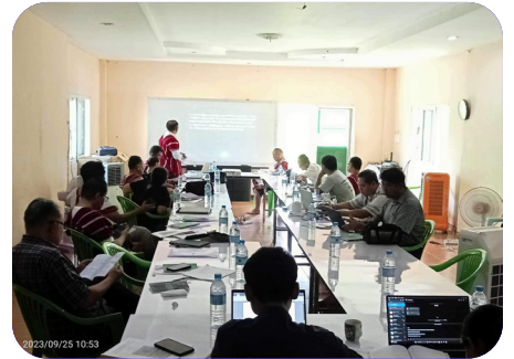
ခုတ်အိတ်ယုတ်-ကညိဒိကလုာ်စာပိတ်ကရု ဟိတ်ဒိဒ်ကပိတ်ကဝဲတံတံအိတ်ဒိဒ် (၂၀၂၃ နှ်)