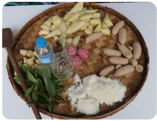
မိာ်လုၢ်ပာ်လၢ တဒုၣ်တထၢ တၢ်ကံၣ်စုကွဲကလၢ

လီၤ. ပုၤဝဲာ်လၢ အဟဲကံၣ်ဃုာ်စုတဖျၢၣ် တချုးက့ၤဒီးဘၣ်န့ၣ် တၢ်ဟ့ၣ်ယုာ်ဝဲ - မ့ၤတီၤ, သံးမံ, သံးမိ, ဒီးတၢ်အိၣ်တၢ်အိၣ်သ့ဝဲန့ၣ်လီၤ. တၢ်ကွဲကလၢဝံၤ သၢသီန့ၣ် ထံဖိကိာ်ကစၢ်ဒုးသ့ၣ်ညါဝဲ တနံၤအံၤ သုတဘျီမၤတၢ်တဂ့ၤ ပကဒုၣ် မ့ၤတီၤလၢာ်.