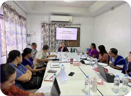
တံတၢ်ပိတ်တံသကိးဘှ်ယုး တံမလကပိ ကညိပိတ်မုဒ် အတံပုတ်ယုတ်ပုတ်ဂိလါ တံဟံဆါ တံတိဒိဒ်ရိတ်မဲအပူ (၂၀၂၃ နှ်)