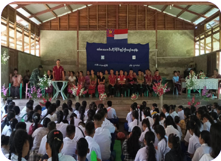
တံမလကပိ ဟိတ်ဒိဒ်ဖျာ် ကွဲးသရ်၊ သရ်မုဒ်မုဒ်နံ (၂၀၂၃ နှ် လါအိးကထိဘာ် ၅ သီ)