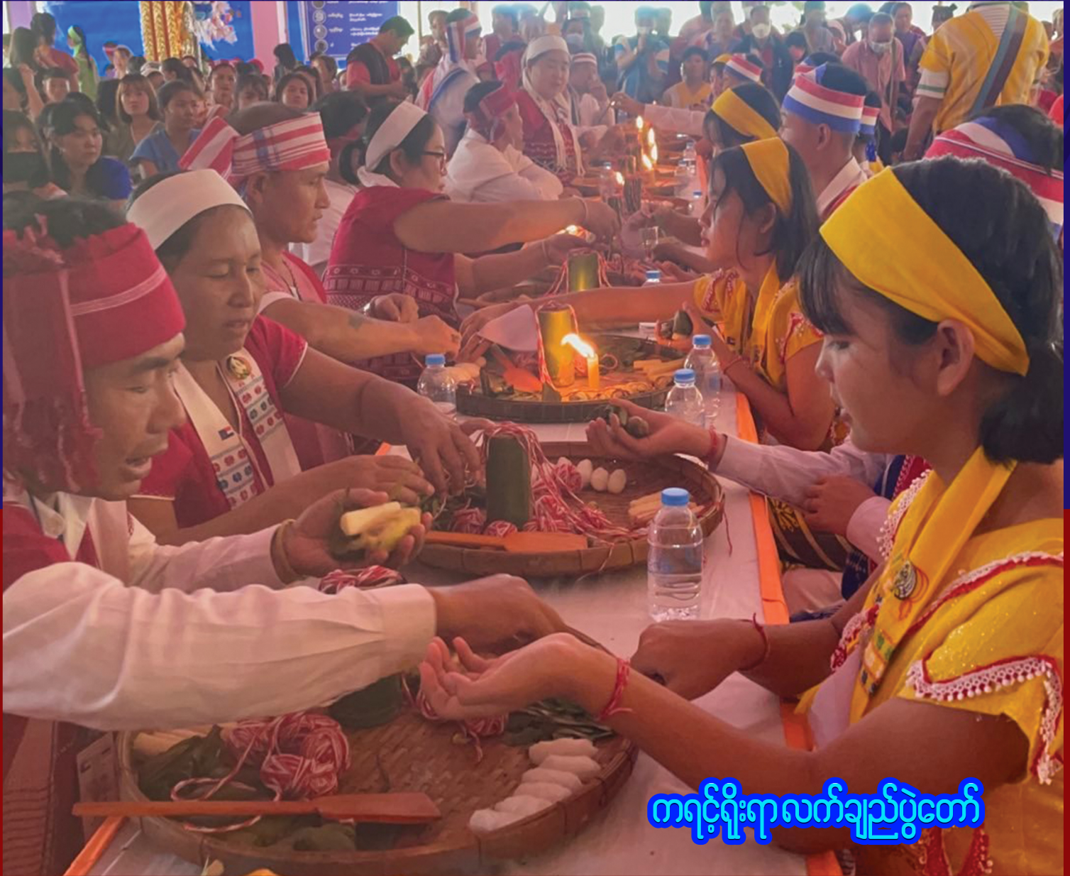
ကရင်ရိုးရာလက်ချည်ပွဲတော်