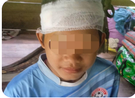
သုးမိစိရိအသုးတဖှ် ခးလိကျိဖးဒိဒ်အယ် ဘှ်ဒိဝဲ မိသု်သးနှ် (၁၅) နှ်တက ဝဲ ဒုပျာ်သတ်ကိရ် (၂၀၂၃ နှ် လါစဲးပထုဘာ် ၁၆ သီ)