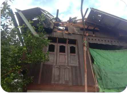
သုးမိစိရိအသုးတဖှ် ခးလိကျိဖးဒိဒ်အယ် ဘှ်ဒိဝဲသဝိမိ (၄) က ဒီး သဝိမိအဟံဟးဂိဝဲတဖှ် ဝဲ ချှ်လွံဂ်ထွာ်ကိရ် (၂၀၂၃ နှ် လါစဲးပထုဘာ် ၁၉ သီ)