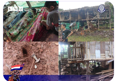
၂ သီအတိဂ်ပူ သုးမိစိရိအသုးတဖှ် ဟံခးလိတါလါကဘိပူ ၈ ဘျီအယ် ကွဲးဟးဂိဝဲ ၁၁ ဖျာ်၊ ကွဲးမိသဝဲ ၄ က ဘှ်ဒိ ၇ က ဝဲ မုဒ်တြိဂ်ကိရ် (၂၀၂၃ နှ် လါစဲးပထုဘာ် ၇ သီ)